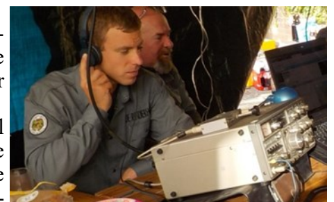
Meeluisteren JOTAJOTI 2018

Ik moest wel even goed nadenken of ik niet te snel van stapel liep. Ik wil het graag goed doen dus de lat ligt bij mij al snel hoog. Je kent dat wel, je bent enthousiast koopt van alles en daarna staat het in een hoek niets te doen. Ik was echter al een paar jaar bezig met het idee om mijn zendmachtiging te behalen.