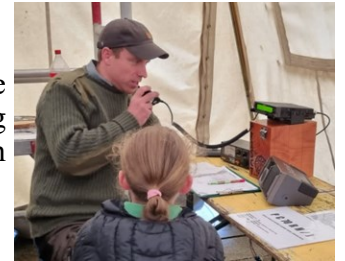
JOTAJOTI 2022 Gerard actief met PC70RH

Ik heb op de JOTAJOTI echt een praktijk weekend gehad. Met het opbouwen en aansluiten kom je de theorie in de praktijk tegen. Een SWR-meter, coax, connectoren, antennetuners en antennes.